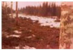
04 mot 4 green