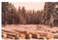
02 från 5 tee