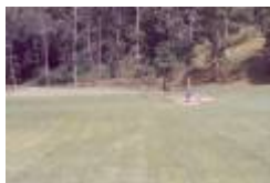
hal 9 tva bunkrar 1965