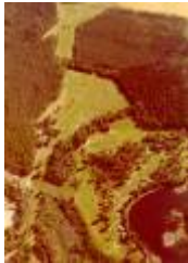
03 hela 9hals banan