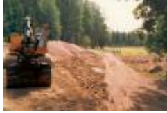
08 TEE 1