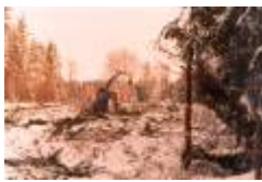
01 från 15 tee