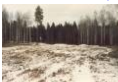
05 fra 14 tee