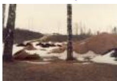
06 mot 8 green