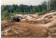
09 green 13 mot fairway