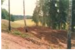
07 TEE 2