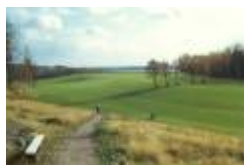
hal 2 1967