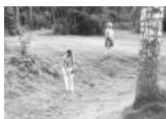
inspel mot 12ans green