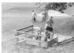
den beromda hissen