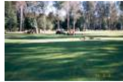
02 ner lagning av slang till fairwayspridare pa 11an