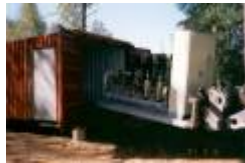
05 dom nya pumparna lyfts in i pumphuset