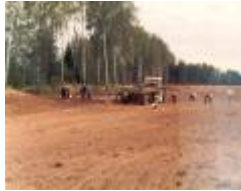
10 stenlockning pa 4an