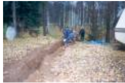
03 Per Tommy lagger ner datakabel fran kontoret