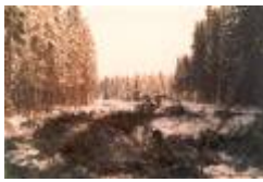
03 14 från ravinen mot green