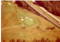
01 nuvarande 3ans green