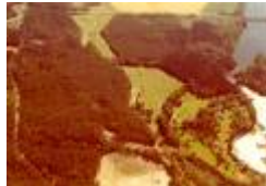
06 banan från badelundaasen