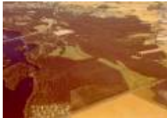
05 hela banan från isaksbo