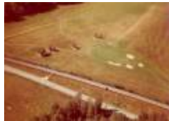
04 nuvarande 3ans green