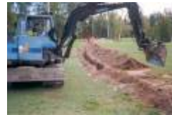
06 ansluter nya pumpstationen till huvudstammen