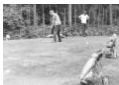
bakom nuvarande 12ans green