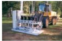
04 nya pumpstationen har kommit