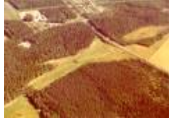
02 nuvarande 2an 16de