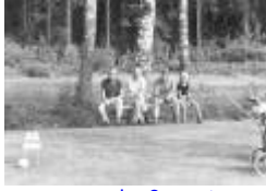
nuvarande 9ans tee