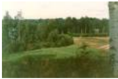
13 ner mot 13de green