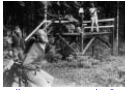
pallen på nuvarande 2an