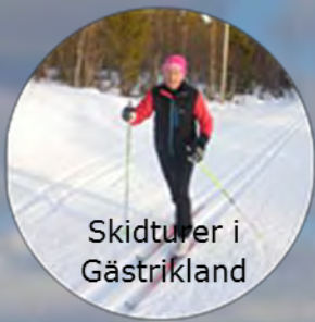
Skidturer i Gästrikland